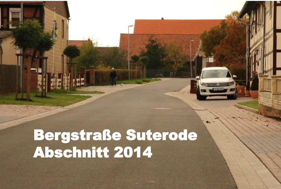
Bergstraße Suterode Abschnitt 2014