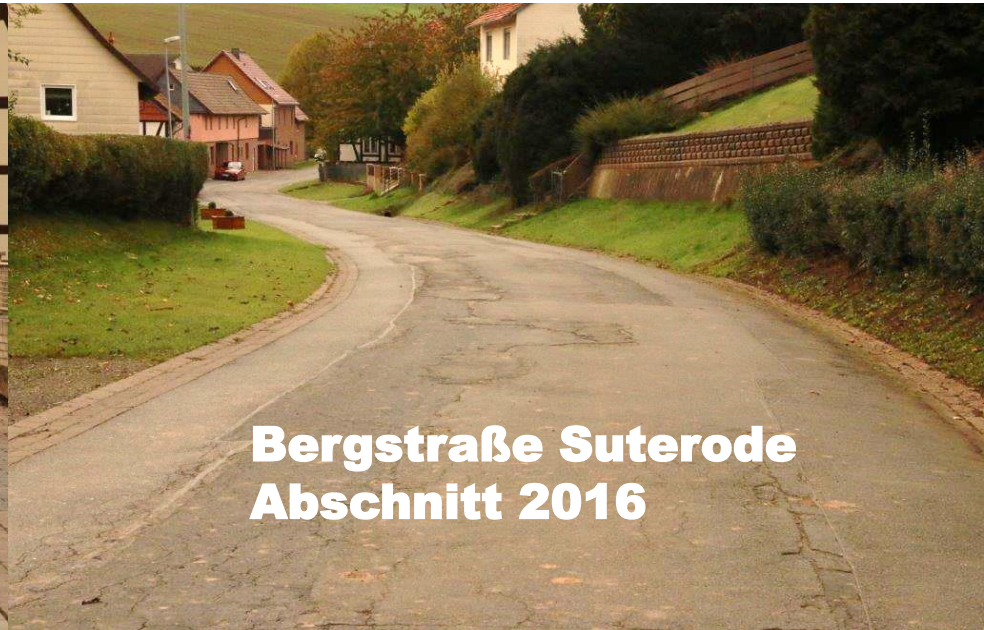
Bergstraße Suterode Abschnitt 2016