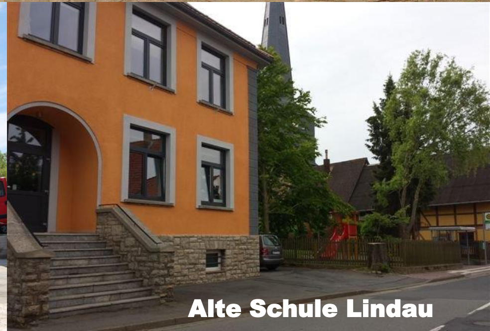
Alte Schule Lindau